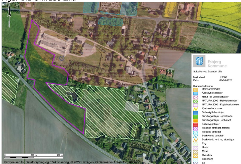
Figur 1.1 Område Lilla

Et projekt som dette vil skabe samspil mellem naturarealerne og bedre beskyttelse af fredede elementer, og derigennem højne områdets kvalitet af natur og biodiversitet.